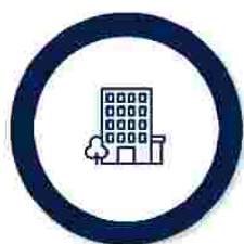
Asigurarea obligatorie pentru locuință

În funcție de nevoile familiei/persoanei singure, venitul minim de incluziune este însoțit de alte drepturi complementare, plătite de la bugetul de stat sau după caz, din bugetul local: