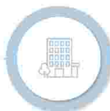
Măsuri suport în domeniul Locuirii