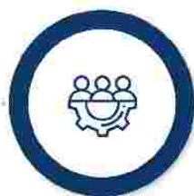
Măsuri suport în domeniul Ocupării