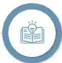
Măsuri suport în domeniul Educației