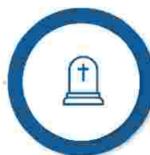
Ajutorul pentru înmormântare