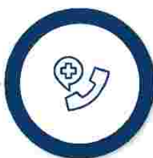
Ajutoarele de urgență (de la bugetul de stat și de la bugetul local)