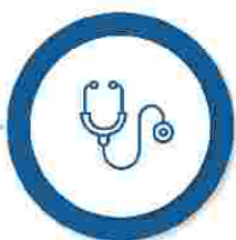
Măsuri suport în domeniul Sănătății