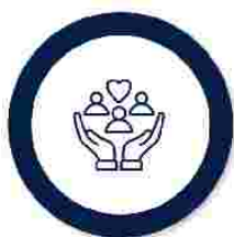
Măsuri suport în domeniul Serviciilor

În funcție de nevoile familiei/persoanei singure, venitul minim de incluziune este însoțit de alte măsuri de asistență socială complementare, acordate în bani și/sau în natură: